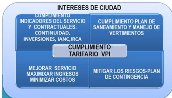
ESTRATEGIA DE PLANEACION Y EJECUCIÓN DE INVERSIONES

Desde el 2006 hemos emprendido la titánica tarea de transformar el pasado, evolucionar y convertir a Cúcuta en una ciudad sostenible, preparada para el futuro, con un servicio de agua potable y saneamiento básico digno para sus habitantes, un desafío inspirador, pero con grandes complejidades en nuestra ciudad cuya infraestructura al inicio de la operación era precaria y con una deficiente cobertura y calidad en la prestación de los servicios . Un reto que, además de obras de inversión por más de 837.000 millones de pesos (a Mayo/2024), en la ampliación y renovación de la infraestructura y otros complementos encaminados a tener resultados inmediatos, asumimos con la utilización de alternativas tecnológicas avanzadas e implementando una estrategia en la planeación y ejecución de inversiones priorizando: cumplimiento de indicadores del servicio, cumplimiento contractual, cumplimiento PSMV y cumplimiento POI tarifario.