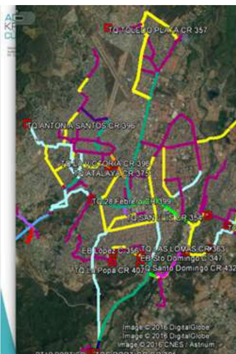
250 KMS DE REDES MATRICES

Nuestro esquema de priorización de los proyectos desde la génesis del contrato de operación se enfocó en brindar la misma posibilidad de acceder a los servicios a todos los sectores de la ciudad, dado que sólo un 37% tenía una continuidad cercana al 100% y existía un lamentable 15% de la ciudad sin servicio de acueducto y alcantarillado. Es así como los primeros años para lograr equidad y a partir de ella mejorar las condiciones para todos, nuestro esquema de priorización se enfocó en eliminar los cuellos de botella o puntos críticos que existían en la infraestructura, Es así como con el fortalecimiento de las redes